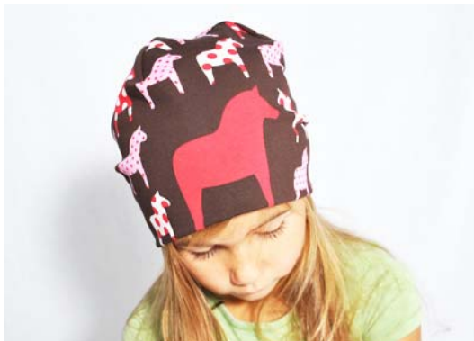
Schnittmuster KU abzügl. 4 cm - kurze Version