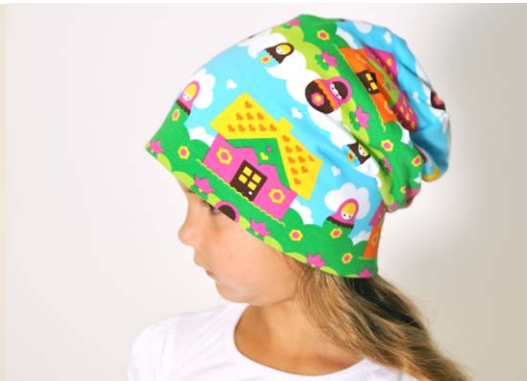
Schnittmuster entsprechend KU – lange Version