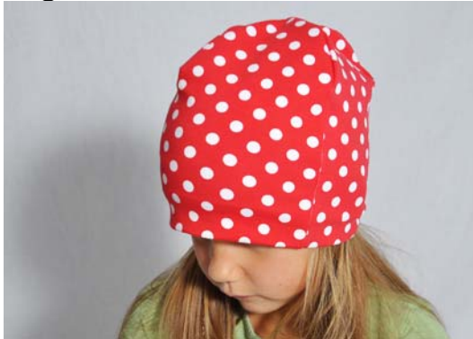
Schnittmuster KU abzügl. 4 cm - kurze Version