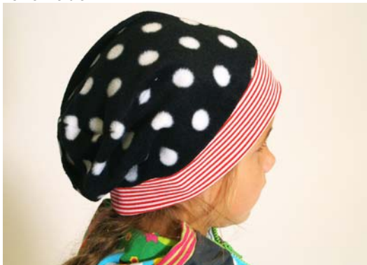
Schnittmuster KU zuzügl. 2 cm - aus Fleece kurze Version