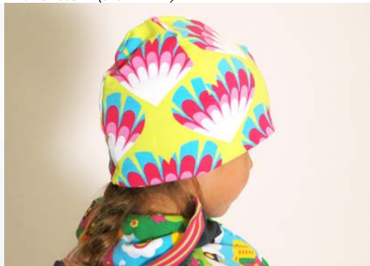
Schnittmuster KU abzügl. 4 cm - kurze Version