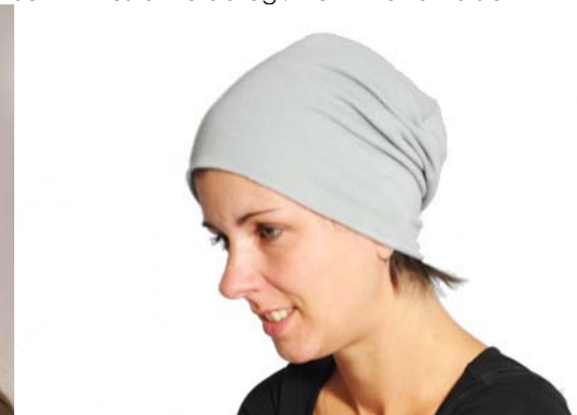
Schnittmuster KU abzügl. 4 cm – lange Version