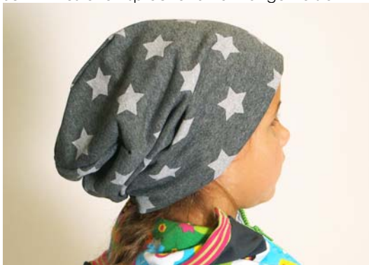
Schnittmuster entsprechend KU – lange Version