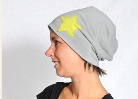
Schnittmuster entsprechend KU – lange Version