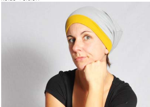
Schnittmuster KU zuzügl. 2 cm - aus Jersey kurze Version