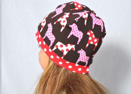
Schnittmuster KU abzügl. 4 cm Futter 4 cm länger zugeschnitten als Außenstoff. (s. S. 17-19)