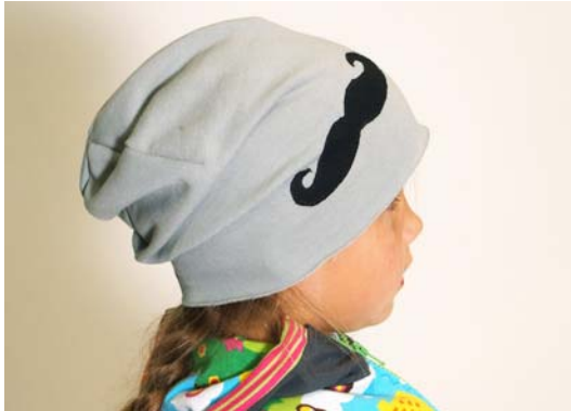
Schnittmuster entsprechend KU – lange Version