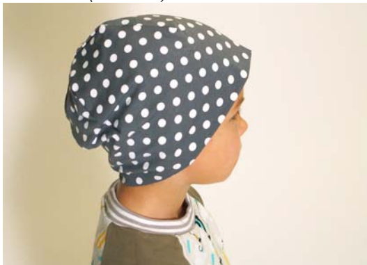
Schnittmuster entsprechend KU – lange Version