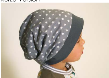
Schnittmuster KU zuzügl. 2 cm – aus Baumwolle/Gewebe