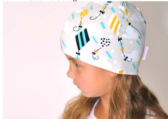
Schnittmuster KU abzügl. 4 cm - kurze Version