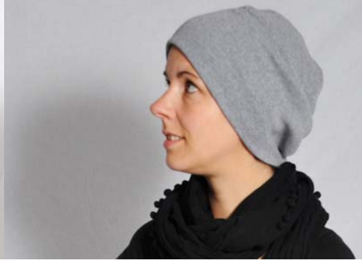
Schnittmuster entsprechend KU – kurze Version