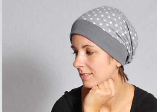
Schnittmuster KU zuzügl. 2 cm – aus Baumwolle, kurze Version