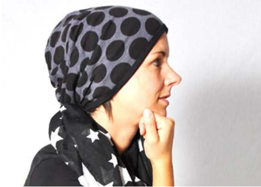
Schnittmuster entsprechend KU – lange Version Futter 2 cm länger zugeschnitten als Außenstoff. (s. S. 17-19)