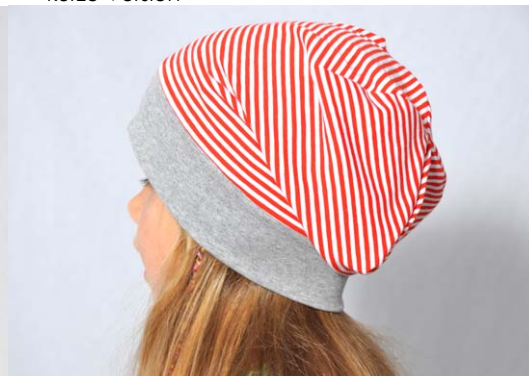
Schnittmuster KU zuzügl. 2 cm – aus Jersey - wendbar