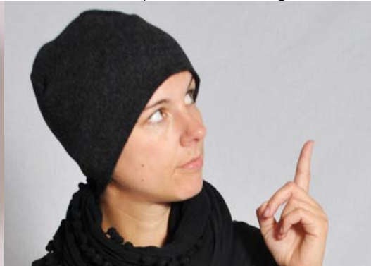
Schnittmuster entsprechend KU - kurze Version aus Walkkloden