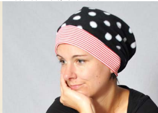
Schnittmuster KU zuzügl. 2 cm – aus Fleece kurze Version