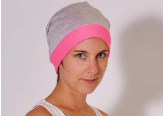
Schnittmuster entsprechend KU – lange Version Rand der Mütze hochgeschlagen