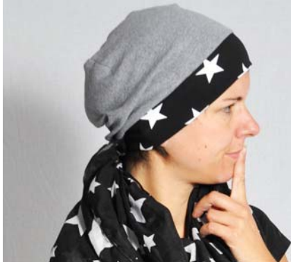
Schnittmuster KU zuzügl. 2 cm – aus Jersey kurze Version